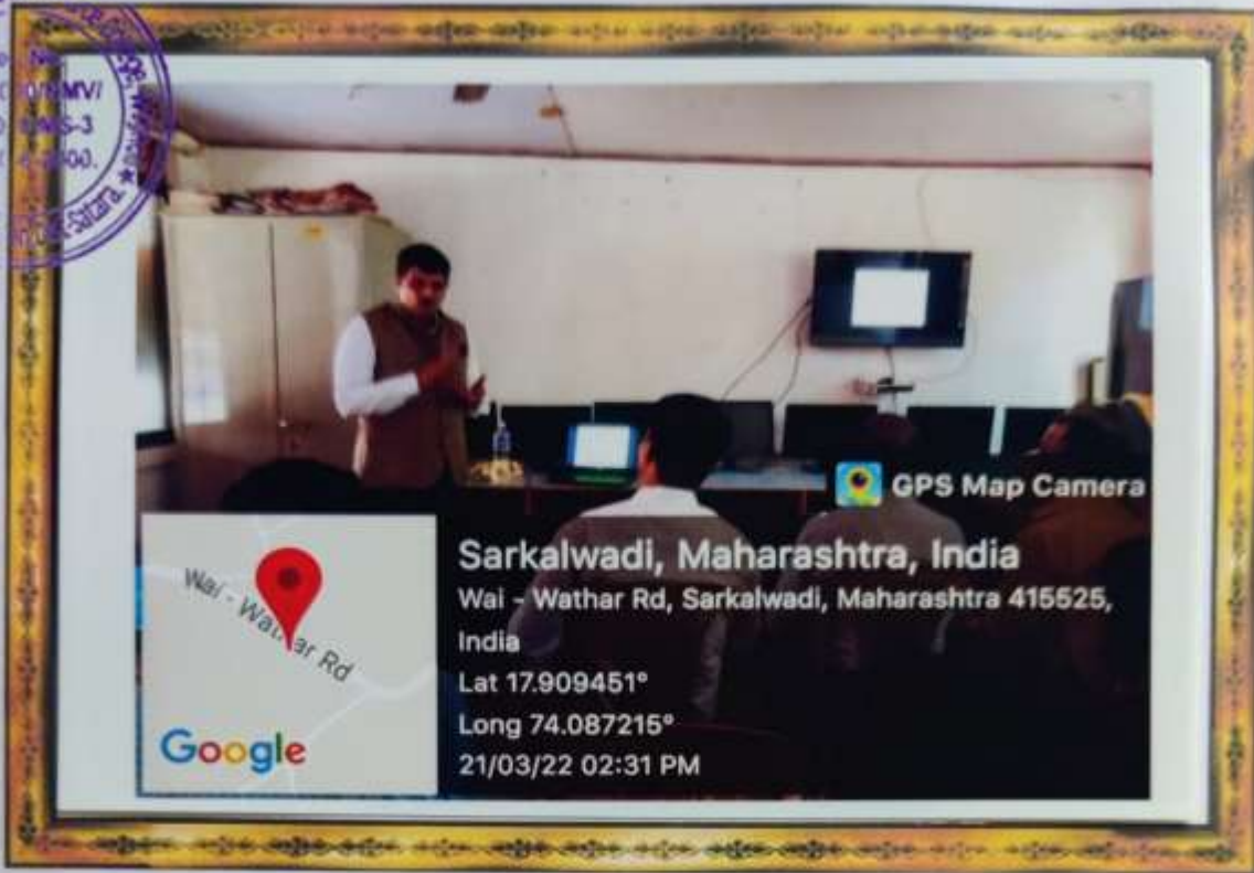
workshop on "Attainment of Programme Outcome and course outcomes"

SHANKARRAO JAGTAP ARTS & COMMERCE COLLEGE, WAGHOLI Re: MVI NG/2019-20 11/2019-3 Dt-30/03/2020 Satara