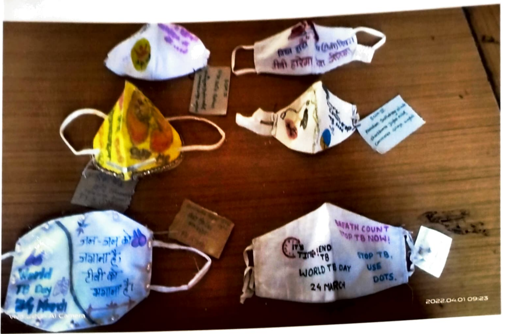
Masks made by Students for 'MaskDesigning' competition