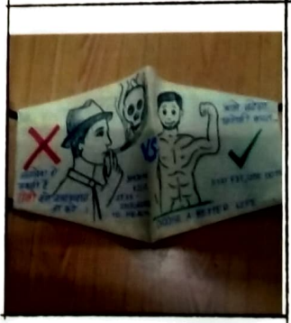
Masks made by Students for 'MaskDesigning' competition